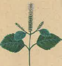
P. frutescens var. citriodora