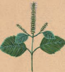
P. frutescens var. citriodora