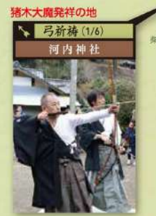
猪木大魔発祥の地 弓祈禱 (1/6) 河内神社