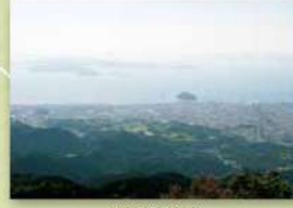
高縄山からの遠望