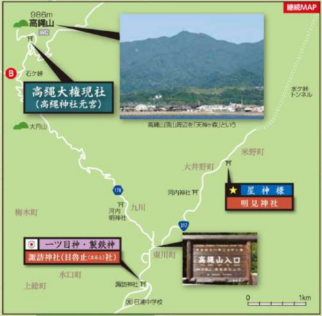
高縄大権現社 (高縄神社元宮)