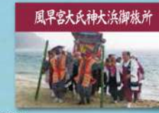
風早宮大氏神大浜御旅所