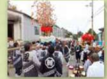
一ツ目神・製鉄神 目暮止(まると)神社